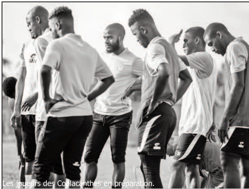
Les joueurs des Cœlacanthes en préparation.

Les éliminatoires de la Can 2021 sont primordiales pour les Comores. En 2019, elles nous avaient échappé sur tapis vert. Aujourd'hui, les ambassadeurs de l'Archipel aux îles de la Lune devront se ressaisir et inverser la tendance, face aux Éperviers de Togo demain jeudi 14 novembre pour la 1ère journée, et aux Pharaons d'Égypte le 18 novembre pour la 2e journée.