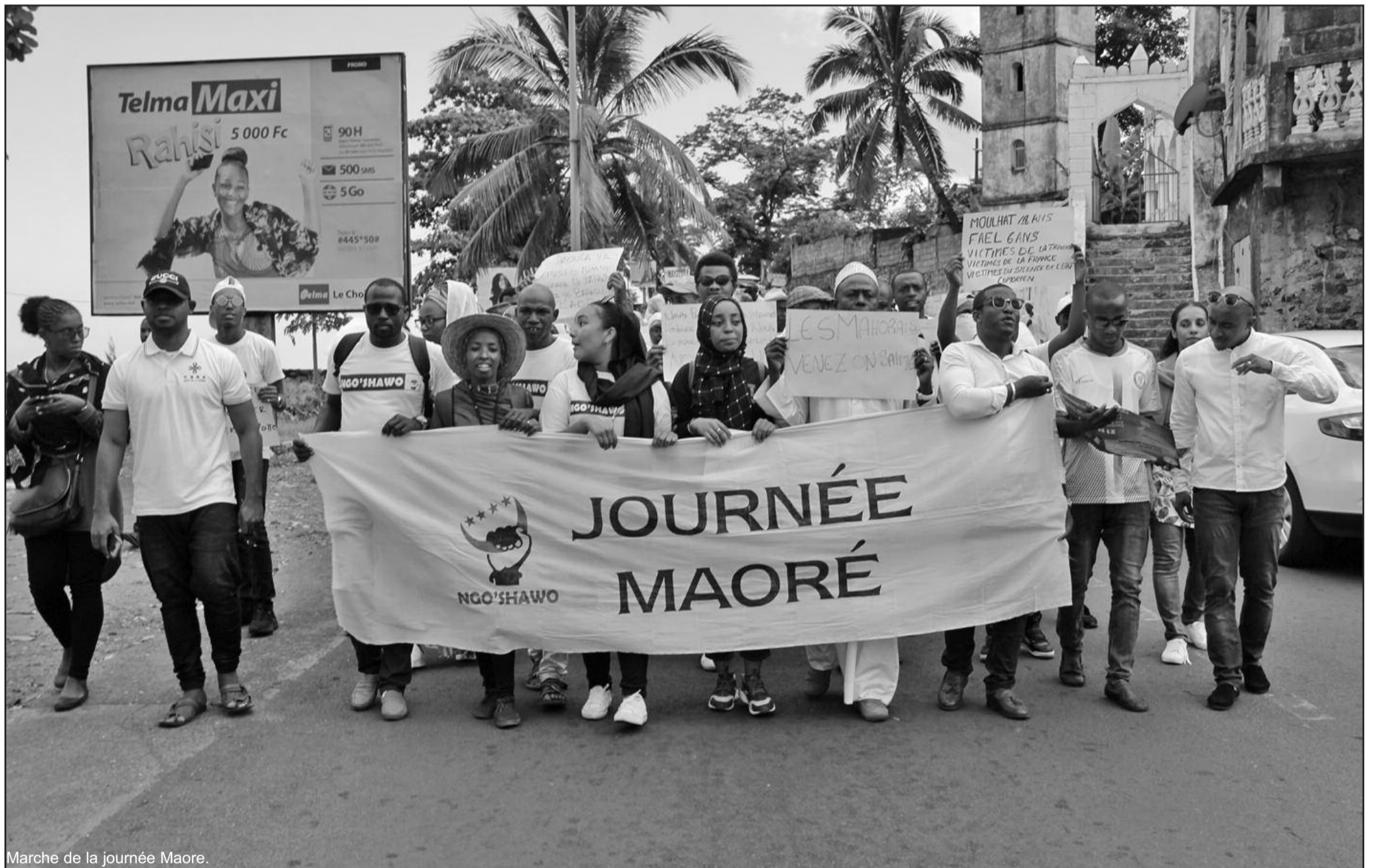
Marche de la journée Maore.

FOOTBALL : ÉLIMINATOIRES CAN 2021 A Lomé, Éperviers et Cœlacanthes, 4e face-à-face