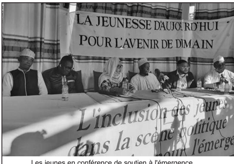
Les jeunes en conférence de soutien à l'émergence.