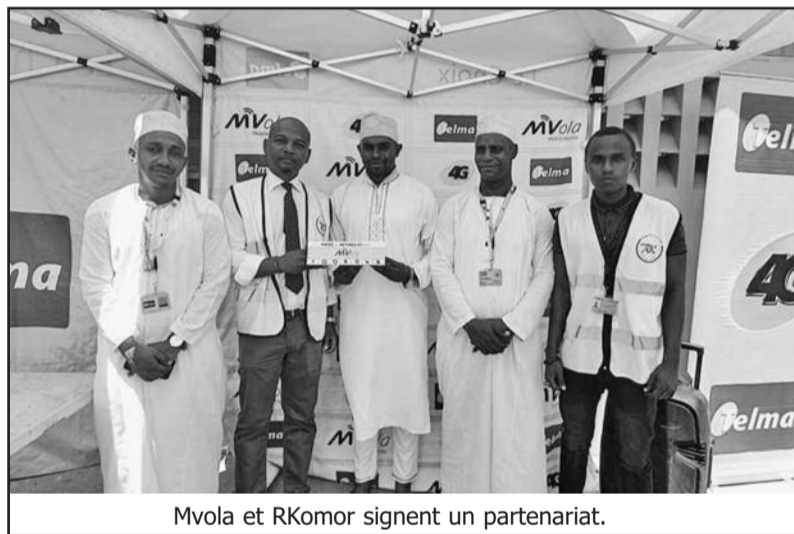
Mvola et RKomor signent un partenariat.