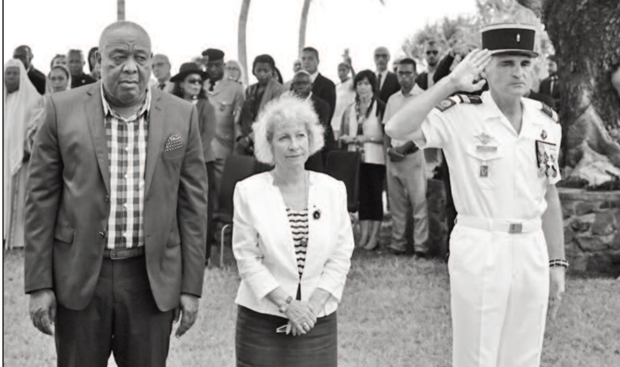
Célébration du 11 Novembre à la Résidence de France de Moroni

l'abonnement à La GAZETTE tellement plus simple Contact 322 76 45 ou 334 33 79